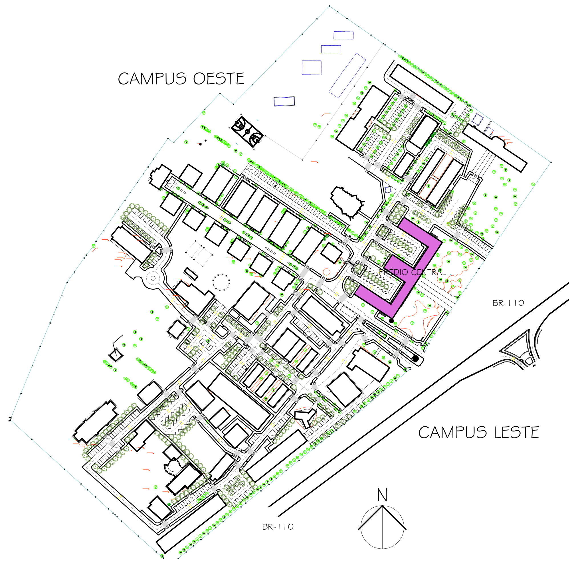
1 PLANTA DE SITUAÇÃO ESCALA: 1/2000